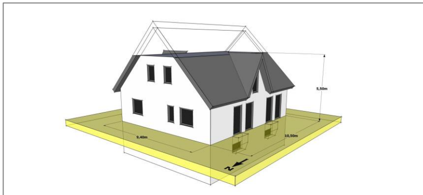
Abb. 2 Einfamilienhaus mit Keller [31]

Die Betrachtungen erfolgen für ein Einfamilienhaus und ein Mehrfamilienhaus mit 40 Wohneinheiten entsprechend ZUB-Modellgebäudekatalog [31].