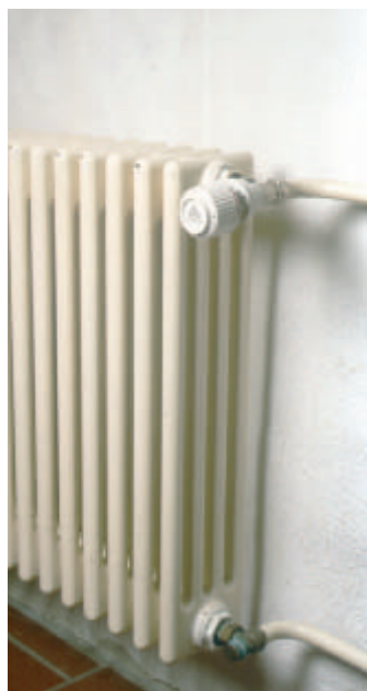
■ An den mit Danfoss-RAVL-Ventilen ausgestatteten Heizkörpern wurden die alten, nicht voreinstellbaren Ventileinsätze gegen neue mit Voreinstellung ausgetauscht und moderne Fühler nachgerüstet.