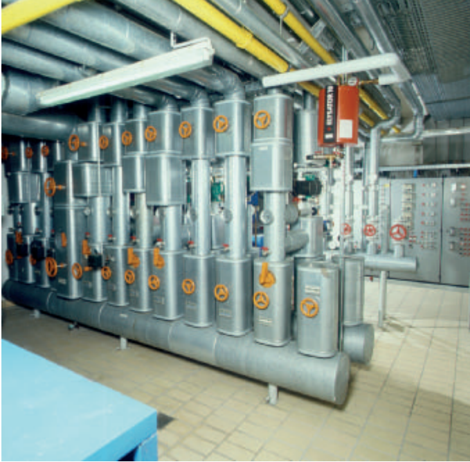
■ Die Heizungsanlage wird mit zwei Gaskesseln (je 367 kW) betrieben. Die vom Verteiler abgehenden Gruppen sind als Zweirohrsysteme ausgeführt.

werden, ohne dass die gesamte Heizungsanlage entleert werden muss. Dazu wird ein besonderes Werkzeug benötigt. In Schmerlenbach hingegen wurde das Heizungswasser abgelassen, weil nach der Montage der Ventileinsätze die drei Stränge durchgespült werden sollten. Dabei gewährleistet die Werkseinstellung „N“ (voll geöffnet) den maximalen Strömungsquerschnitt zwischen Sitz und Kegel. Nach dem Füllen und Entlüften der Stränge wurden alle Ventileinsätze voreingestellt