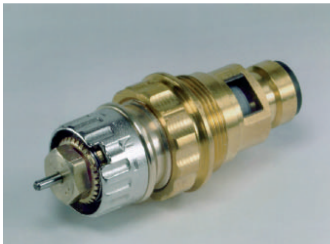
■ Die voreinstellbaren Danfoss-Ventileinsätze eignen sich für 20 bis 30 Jahre alte RAV- und RAVL-Ventilgehäuse.

Das Umrüsten der Ventileinsätze kann vorgenommen