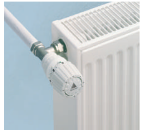
■ Die Umrüstung eines alten Thermostatventils ist schnell gemacht. Dazu wird der alte, nicht voreinstellbare Ventileinsatz mit wenigen Handgriffen gegen einen voreinstellbaren ausgetauscht. Zum Lieferumfang gehört ein Thermostatkopf.

reduzierung. Deshalb ist die Frage, wie viel Primärenergie sich durch die Aufrüstung alter Thermostatventile – also von festem k_v - auf variablen k_v -Wert – einsparen lässt und wann sich die Investition amortisiert. Aufschluss gibt die vergleichende Betrachtung der Heizzeiten, des Nutzungsverhaltens, der Gasverbrauchswerte sowie der meteorologischen Daten für die Zeiträume Januar bis April 2002 und Januar bis April 2003, also vor und nach der Umrüstung.